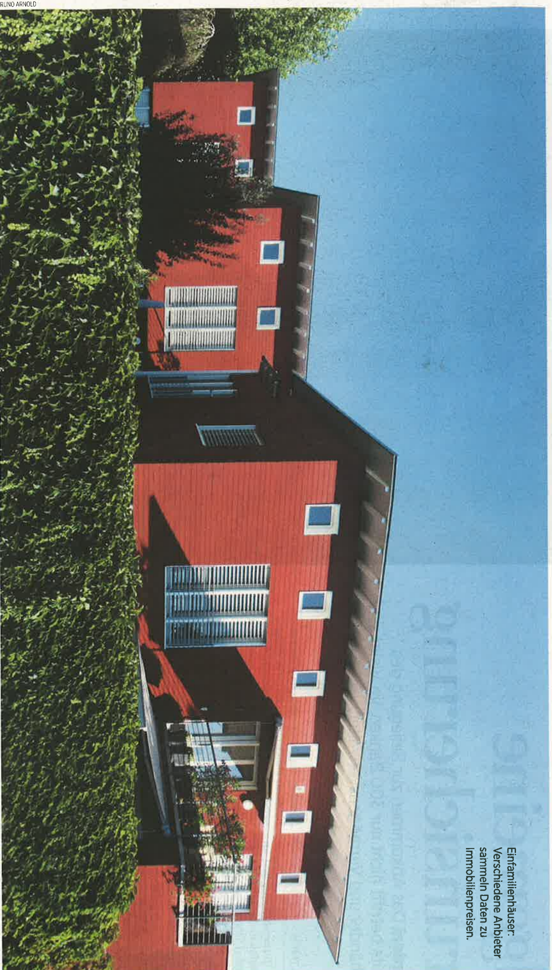
Einfamilienhäuser: Verschiedene Anbieter sammeln Daten zu Immobilienpreisen.